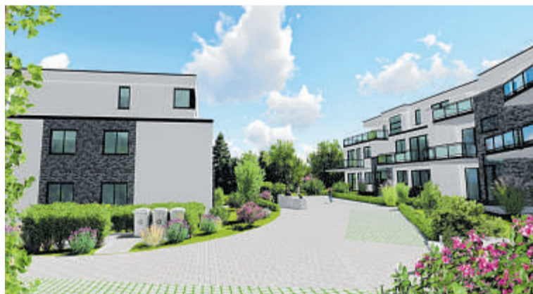
So werden die vier Häuser, die zum Projekt „Mühlenterrassen“ gehören, nach der Fertigstellung aussehen.

Besonders begehrt sind Objekte in Wassernähe. Und wen wundert's, dass bereits vier Wochen, nachdem das Objekt „Mühlenterrassen“ an der Straße Neukircher Mühle auf dem Markt angeboten wurde, 80 Prozent der Wohnungen verkauft sind – nach nur wenigen Metern erreicht man die Ruhr und den Baldeneysee. Der kleine Wohnpark liegt weit zurück von der Straße, auf einem über 3000 Quadratmeter großen Grundstück. Parkplatzprobleme wird es voraussichtlich nicht geben – die Anlage wird über eine Tiefgarage verfügen.